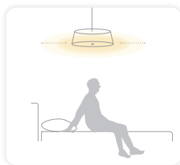
Bij het rechtop zitten zacht licht