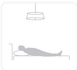
Tijdens het slapen geen licht